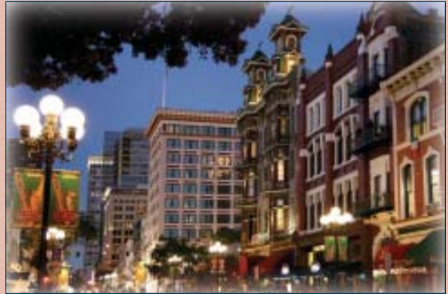
The U.S. Grant Hotel sits alongside the vibrant Gaslamp Quarter.

Considerando su rango como una de los primeros tres destinos en los Estados Unidos para visitar y hacer convenciones, San Diego es una ciudad paradisiaca a lo largo del año. Localizada en el soleado sur de California, mantiene una temperatura promedio de 20°C invitando a un estilo de vida deportivo y de descanso. Desde navegar en la bahía de San Diego, jugar golf en un campo de nivel mundial hasta una cata de vino en Temecula Valley, la ciudad ofrece un sin número de opciones para escaparse, energizarse y descubrir.